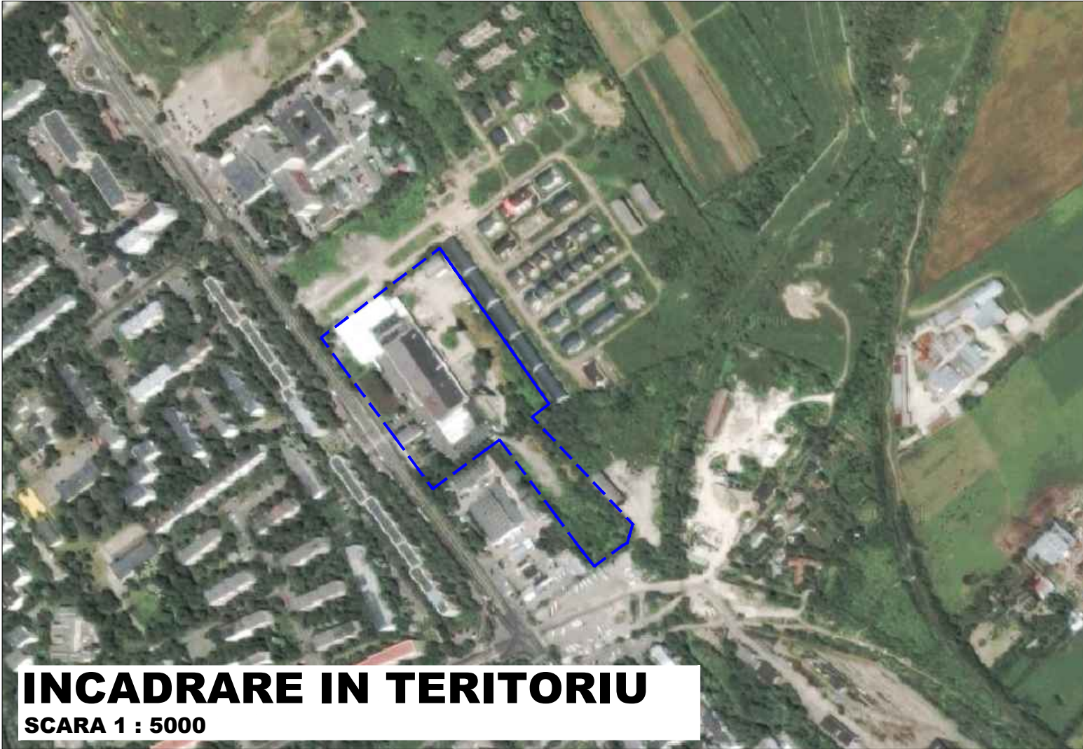
INCADRARE IN TERITORIU SCARA 1 : 5000